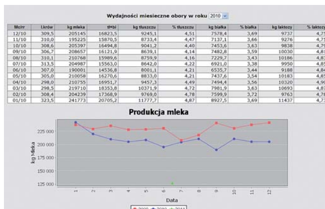
Rys. 1. Produkcja stada